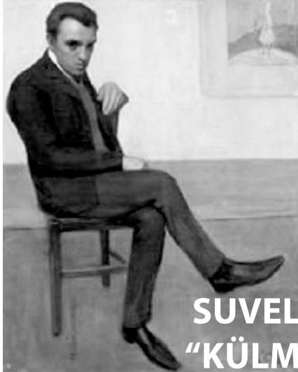
SUVELAVASTUS “KÜLMETAVA KUNSTNIKU PORTREE”